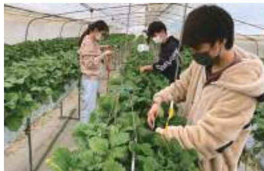
伊達市のいちご農家でハウス調査中(右手前)