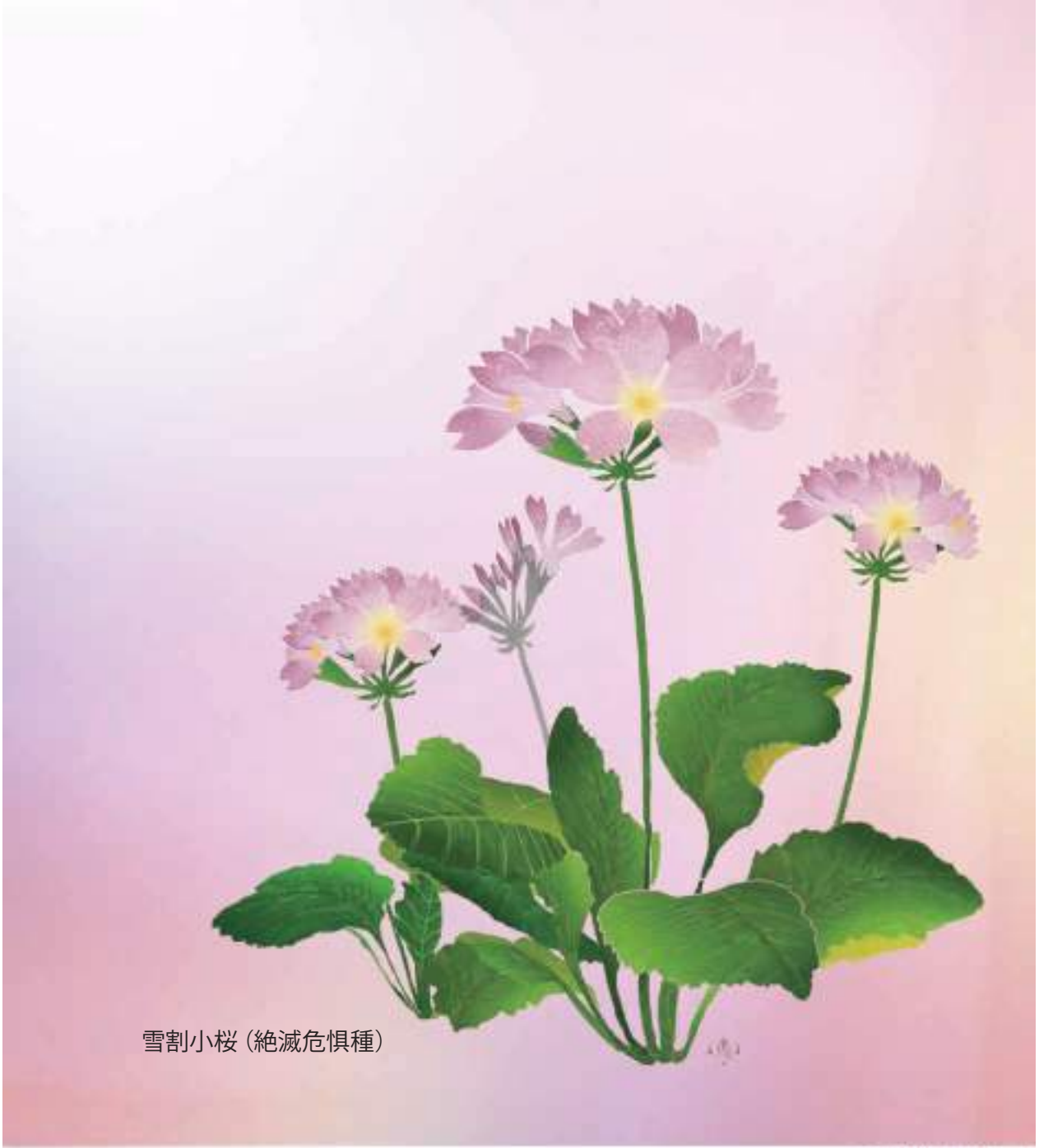
雪割小桜(絶滅危惧種)